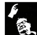
Lycée Salvador Allende HEROUVILLE ST CLAIR