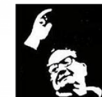
Lycée Salvador Allende HEROUVILLE ST CLAIR