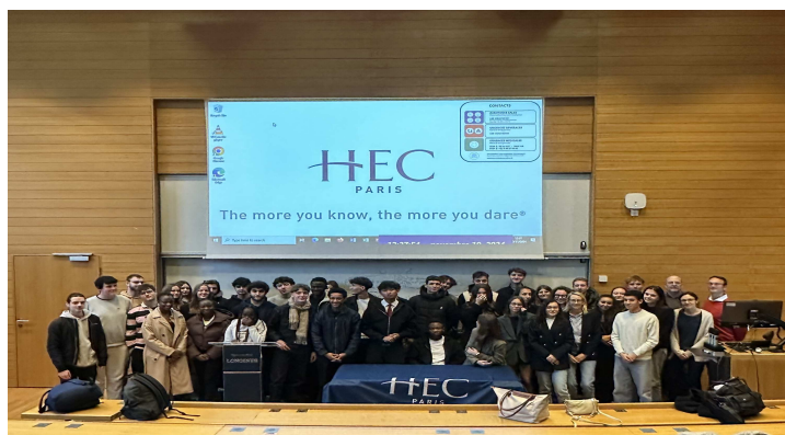
Visite à HEC (2024)

Spécificité de la classe préparatoire : un accompagnement personnalisé grâce au système de « colles ». Ces séances d'entraînement, dispensées par des professeurs de la classe préparatoire, de lycée, de BTS ou d'université, s'effectuent individuellement ou par groupe de trois étudiants.